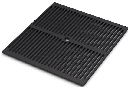
Copy 8100 617